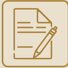
فسخ العامل العقد