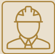
ترك العمل بدون سبب مشروع