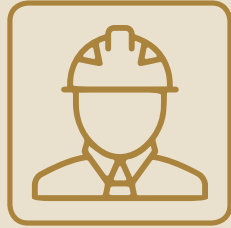
ترك العمل بدون سبب مشروع