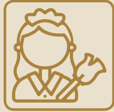
عدم أداء العامل لمهامه بالشكل المطلوب